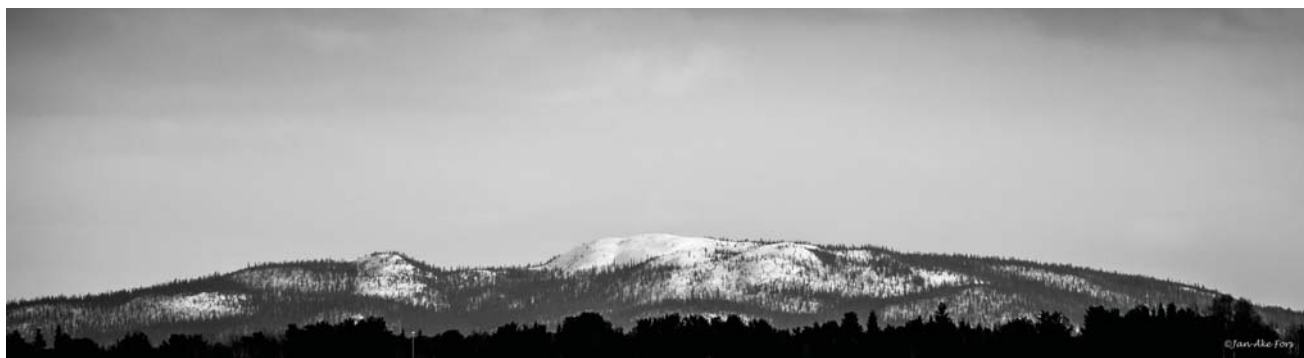
Naankitunturi 514 höjdmeter över havet, Påskdagen 2015