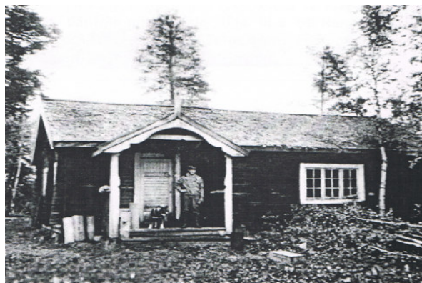
Gruvstugan. Bertil Falck på broplan. Foto: Julia Falck, 1960-talet

Det en gång så ståtliga gruvnybygget borde återuppbyggas till ursprungligt skick, för att ingå i Trollsparens (Vittangi Camping) kulturturistiska satsningar i Vittangi. Dessutom borde hela Vittangifältet inventeras och kartläggas med stigar och andra lämningar efter malmletningsepoken (enl. förslag av Yngve Johansson).